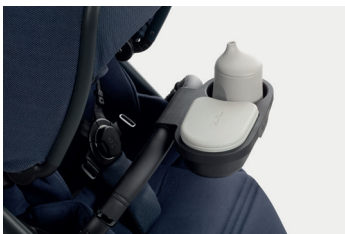
Svačinový pultík na kočárek Dune/Reef/Clic