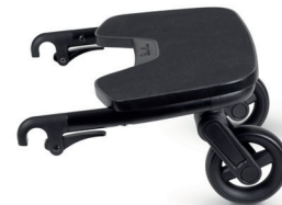
Stupátko Ride-on-Board za kočárek Dune/Ree