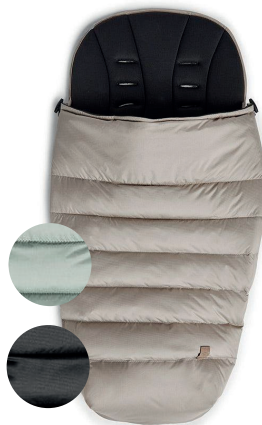
Silver Cross Tide sada doplňků Stone Sada doplňků pro kočárek Silver Cross Tide obsahuje luxusní fusak, stylový přebalovací batoh, držák na nápoje a držák na mobil.