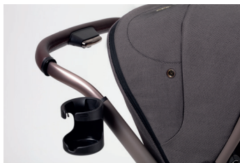
Držák nápojů pro kočárek Dune/Reef