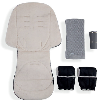
Zimní sada pro kočárek Sada obsahuje luxusní sedací podložku, pletenou deku, teplé rukavice na rukojeť kočárku a termohrnek.