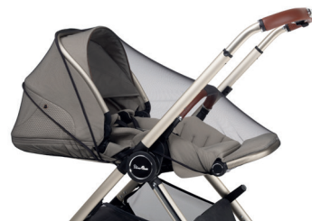
Moskytiéra pro kočárek Dune/Reef