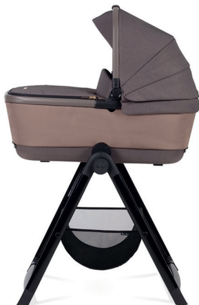
Stojan na korbičku Dune, Reef